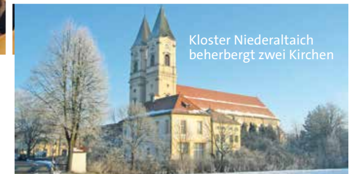
Kloster Niederaltaich beherbergt zwei Kirchen