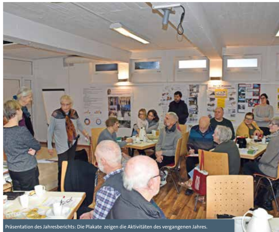
Präsentation des Jahresberichts: Die Plakate zeigen die Aktivitäten des vergangenen Jahres.